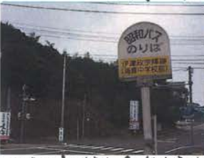
伊達政宗陣跡(佐野原村)