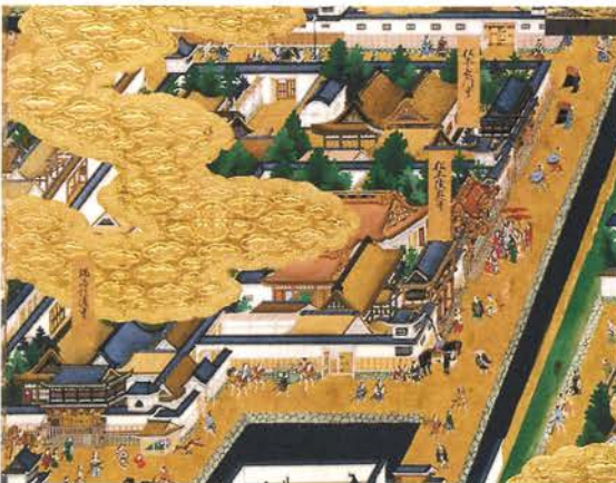
不公平屋敷(江戸日比谷公園)