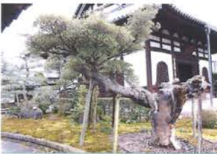
海宝寺のモッコク(伏見市) (キョウトヒヨリ)