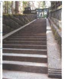
鉢形宮 鉢形宮 鉢形宮