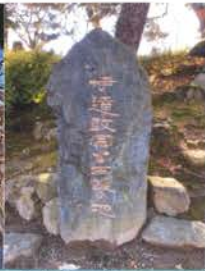
政宗公生地地蔵 同(倉山城)